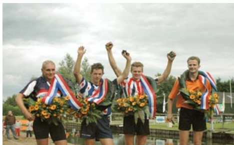
De Nederlandse Kampioenen van 2005.

De verwachting is dat dit gezamenlijke reglement voor de start van het seizoen 2007 gereed is.