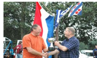
Zowel de Nederlandse Kampioenschappen als de jaarlijkse Tweekamp tussen Holland en Friesland worden georganiseerd onder auspiciën van de NFB